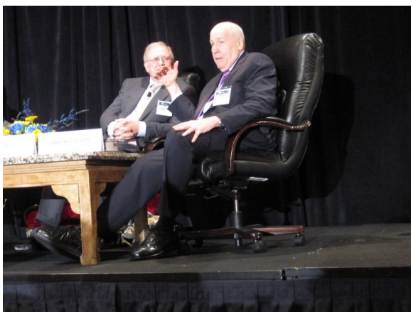
เอ็ด ซีโคตา (Ed Seykota)

“หากสิ่งไหนที่คุณไม่สามารถวัดค่ามันได้ ก็ยากที่คุณจะจัดการกับมัน... แต่สิ่งใดที่คุณวัดค่า มักจะถูกพัฒนาไปในทางที่ดีขึ้น”